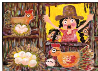
第 25 回金賞入選作品「めんどり」 (タイ 7 歳・女)